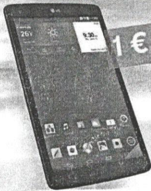
TABLET LG G PAD 8.0 LTE

Predĺžte si zmluvu s paušálom Happy Profi a novým akčiovým tabletom. 4G smartfón od nás dostanete ako darček. Zistite viac! Kliknite sem.