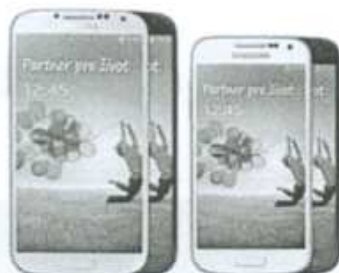
Samsung GALAXY S4

vyberte si špičkový Samsung s originálnym krytom za polovicu